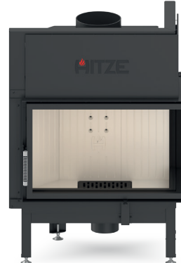
ALBERO AL14 R.H