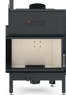
ALBERO AL14 L.H