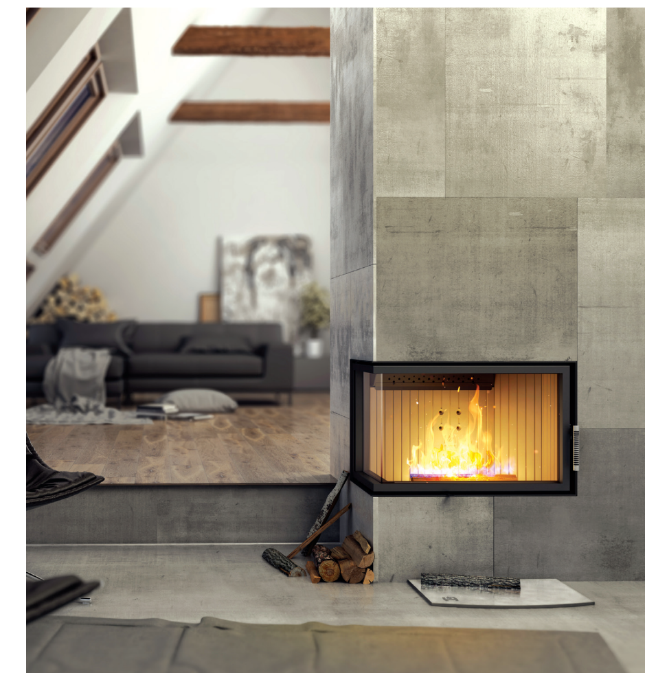
Wkład kominkowy ALBERO AL14 L.H