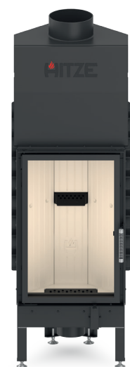
ALBERO AL14 S.V*

możliwość zmiany kierunku otwierania drzwi wkładu