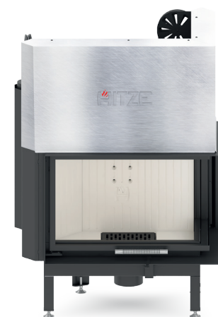
ALBERO AL14 RG.H