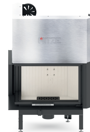
ALBERO AL14 LG.H