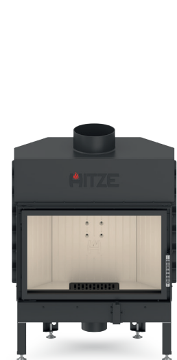
ALBERO AL14 S.H

Dodatkową zaletą maskownic wkładów kominkowych jest prosty sposób montażu, który można przeprowadzić samodzielnie.