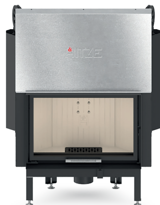
ALBERO AL14 G.H

możliwość zmiany kierunku otwierania drzwi wkładu